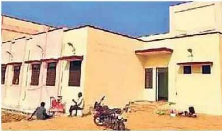
पाली. अल्पसंख्यक छात्रावास।

मुस्लिम, सिख, ईसाई, जैन, पारसी, बौद्ध बच्चों को दिया जाना है प्रवेश