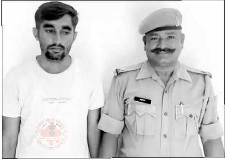
पुलिस गिरफ्त में मुख्य आरोपी अभ्यर्थी।

अजमेर, (कासं)। राजस्थान लोक सेवा आयोग द्वारा आयोजित वरिष्ठ अध्यापक हिंदी परीक्षा-2022 में अभ्यर्थी द्वारा अपने स्थान पर डमी अभ्यर्थी बैठाने वाले आरोपी को पुलिस ने गिरफ्तार किया है। अजमेर पुलिस गिरफ्तार आरोपी अभ्यर्थी को अदालत में पेश करेगी। पुलिस जांच में सामने आया है कि डमी अभ्यर्थी आरोपी का दोस्त था और दोनों के बीच पांच लाख में परीक्षा देने का सौदा हुआ था। आरोपी ने एडमिट कार्ड में दोस्त की फोटो लगाकर परीक्षा में बैठाया। पूर्व में पुलिस डमी अभ्यर्थी को पकड़कर न्यायिक अभिरक्षा में जेल भेज चुकी है। पुलिस मामले की जांच में जुटी है।