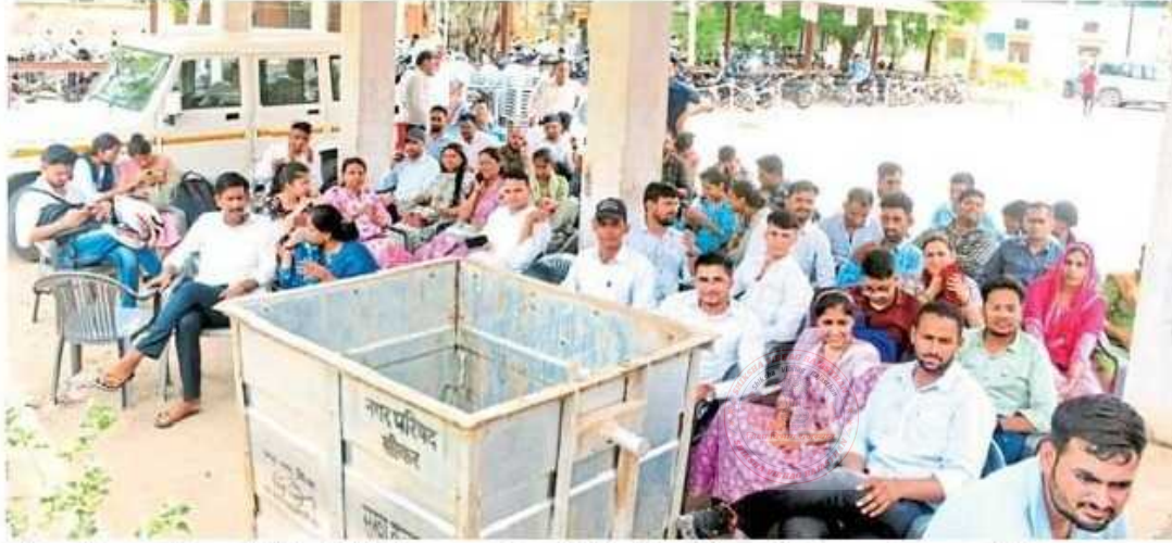
सीकर. जिला परिषद में पिछले दिनों हुए कार्यक्रम में नियुक्ति लेने उमड़े बेरोजगार (फाइल फोटो)

सीईटी स्नातक स्तर परीक्षा में अब निगेटिव मार्किंग भी