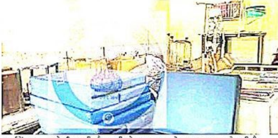
गवर्नमेंट स्कूल सोमारिया की लैब बनी गोदाम, स्कूल के अन्य सामान से भरी है।

कक्षा 12वीं में साइंस विषय के रिजल्ट में चौकाने वाले नामांकन नजर आए। सोमारिया सीनियर सैकेंडरी स्कूल में साइंस विषय में एक, गवर्नमेंट सीनियर सैकेंडरी स्कूल भोरा में दो और गवर्नमेंट सीनियर सैकेंडरी स्कूल कैथुदा में केवल दो ही स्टूडेंट्स का नामांकन रहा है। वहीं, 15 से कम नामांकन में बड़गांव, गवर्नमेंट सीनियर सैकेंडरी स्कूल नयागांव में 6, मोडक गांव में 10, चेचट में 10 और देवलीकला में 10 नामांकन हैं।